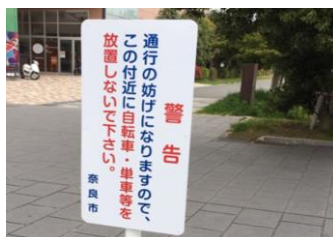
高の原イオン前の警告看板