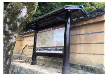
秋篠寺門前の案内板の改修

ふじ田さちよホームページ http://www.komei.or.jp/km/nara-fujita-sachio/