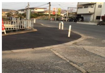
西大寺北小前の歩道改修