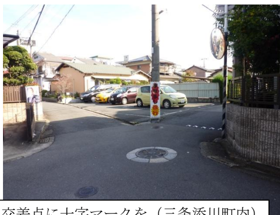
交差点に十字マークを（三条添川町内）

その他今年度での質問テーマ ○耐震改修促進事業について ○土砂災害防止対策工事について ○中核市市長会からの提言について ○新斎苑整備事業について ○家庭系ごみの有料化について （詳しくは奈良市議会のホームページから検索してください。）