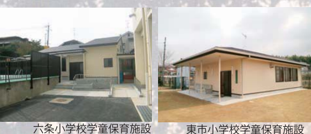
六条小学校学童保育施設