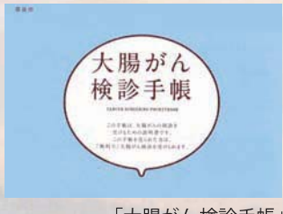
「大腸がん検診手帳」