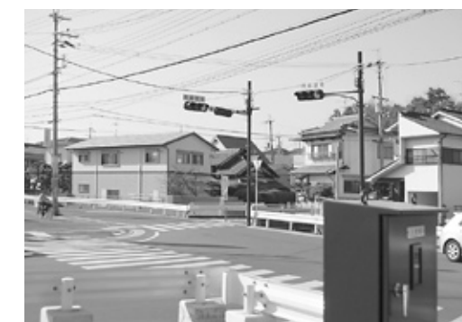
大和中央道菅原工区 (H21年4月1日信号機設置)