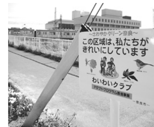
アダプトプログラムで進む地域の美化