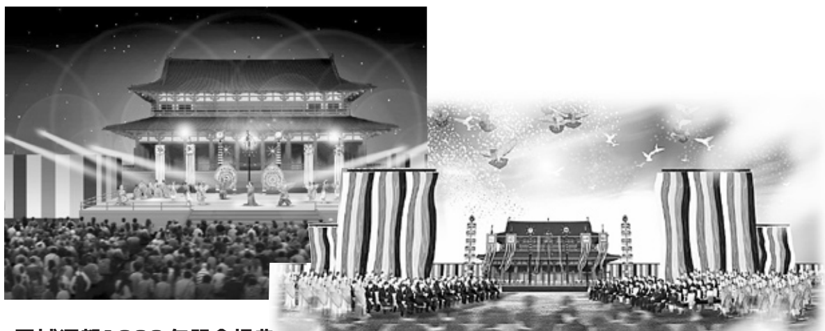
平城遷都1300年記念祝典