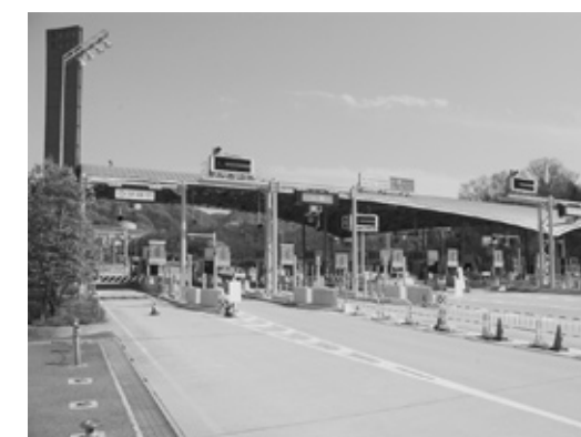
第2阪奈道路にETC設置完了 (H21年4月16日より供用開始)