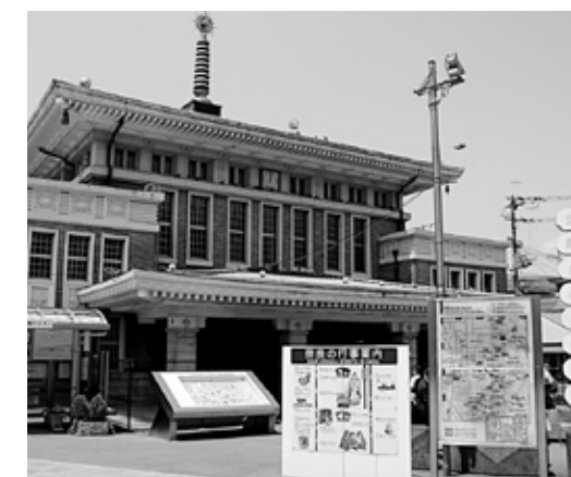
観光総合案内施設となるJR奈良旧駅舎 (H21年度秋頃オープン予定)