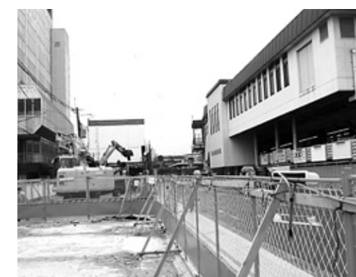
西大寺駅南地区土地区画整理事業 (H21年4月現在)