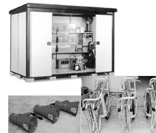
自主防災組織に初動設備を配置