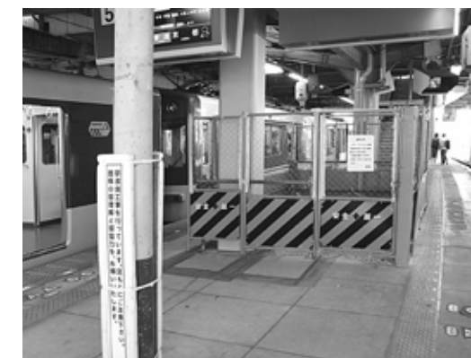
近鉄大和西大寺駅エレベーター設置 (H21年秋頃完成予定)