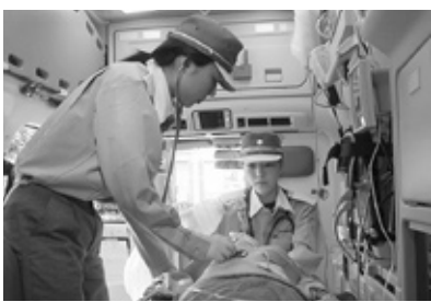
高規格救急車内部

東部地域の救急件数は増加傾向にあることは認識している。救急救命士の養成状況と併せ順次配備し全ての救急隊に救急救命士の配置