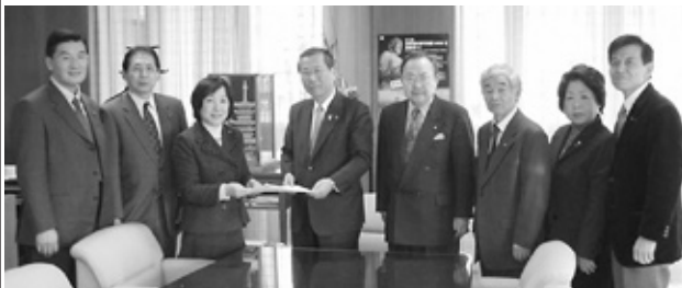
定額給付金要望書を提出する公明党奈良市議団 (1月20日)

平成21年1月1日以降、病院は妊産婦から1分娩当たり3万円を徴収し、掛金として運営組織に納入します。脳性麻痺等の当該事故が発生した場合は、病院は運営組織を通じ損害保険会社から保険金を受け取り、当該児に補償金として、一時金と分轄金の計3千万円を支払うこととなります。