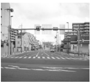
都市計画道路芝辻大森線